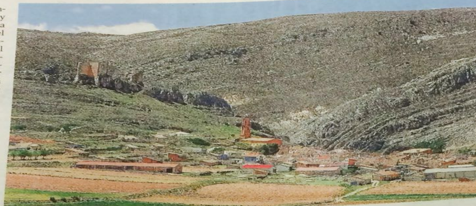
Vista de Huesa del Común, a los pies del castillo de Peñaflo.